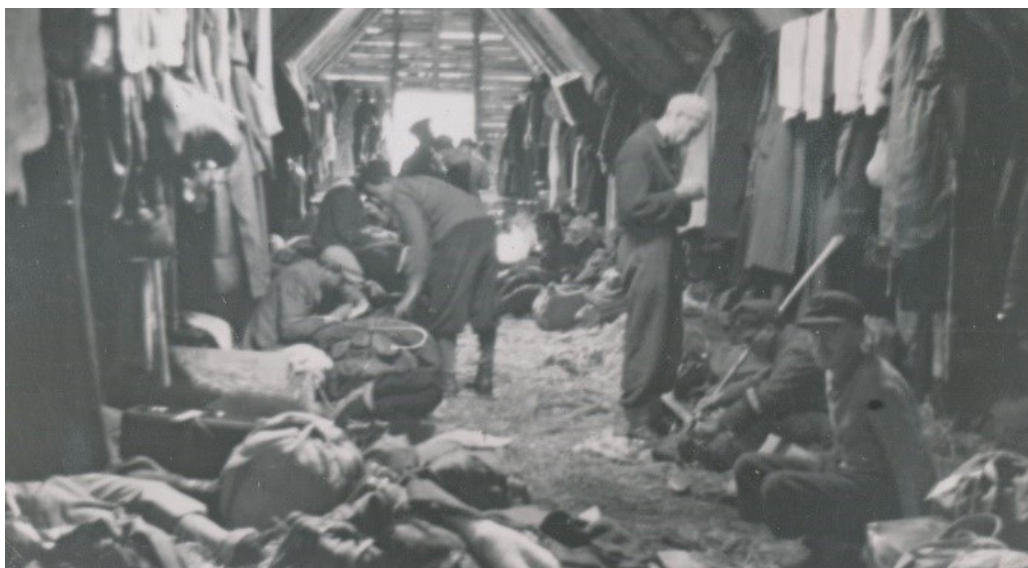
Fotó 11 Munkaszolgálatosok a lakóépületükben