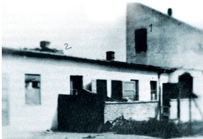
Obrázok 4 Nitrianska ješiva (Lehmann 2019 online)