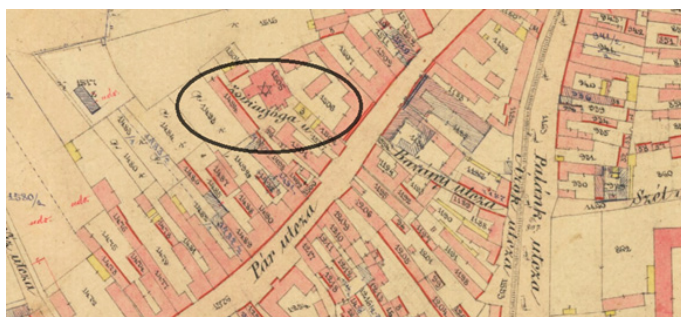
Obrázok 2 Párovská židovská obec ešte so starou synagógou 6

So zemepanskou obcou Párovce hraničila Híd utcza (dnes Mostná). Po ich pripojení sa Nitra stala najväčším mestom župy. K úradnému zániku zemianskej obce Párovce došlo 1. januára 1886, keď prebehlo formálne pripojenie k mestu, s ktorým postupne toto významné predmestie splynulo. Hlavnou tepnou bola Párutca (dnes Párovská ulica), ktorá sa napájala na Gyürkiutcza (dnes Ďurkova).