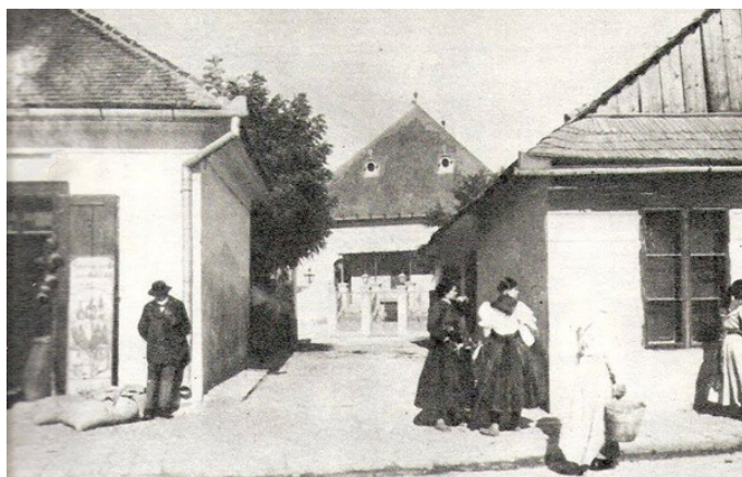
Obrázok 3 Pôvodná párovská synagóga v roku 1904 (v strede fotografie), pohľad z Párovskej ulice (Vnuk 2020, 234)

Ďalšia kompaktná výstavba Nového mesta-Pároviec a premena tohto pôvodne židovským obyvateľstvom obývaného priestoru si vyžiadala zánik Svätoštepanského námestia (dnes už zastavaný priestor okolo Kostola Sv. Štefana Kráľa v Párovciach) a premeny ďalších verejných priestorov. Medzi ďalšie významné lokality patrilo okolie dnešnej Schurmannovej ulice, ktorá je kolmá na Párovskú ulicu. Nachádzala sa tu známa židovská škola Thalmud Tóra, rabínska škola ješiva, nemocnica a starobinec (Borský a kol. 2012, 3). Pôvodná budova synagógy z roku 1818 a ulica U synagógy ustúpili asanácii (obrázok 2 a 3). Dnes je táto časť bývalej prímestskej obce hraničiaca s mestským parkom husto zastavaná obytnými domami.